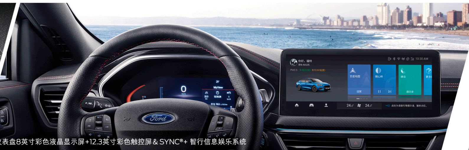
仪表盘8英寸彩色液晶显示屏+12.3英寸彩色触控屏& SYNC®+ 智行信息娱乐系统