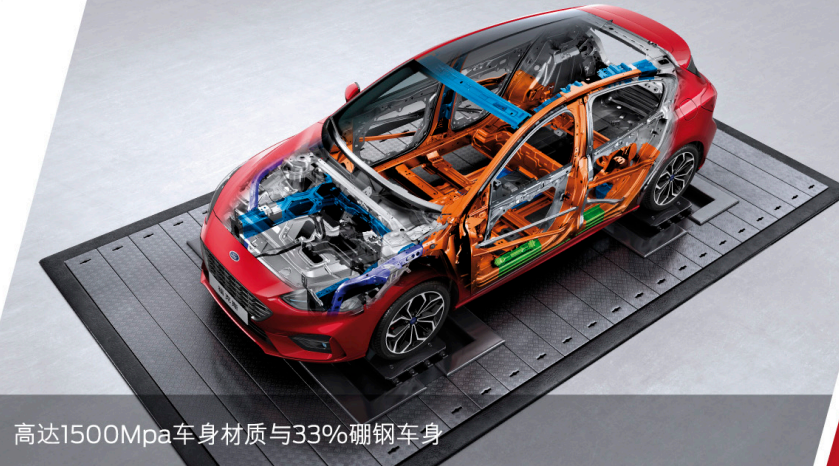
高达1500Mpa车身材质与33%硼钢车身

E-NCAP(2018年) 碰撞测试5星安全评级 FORD FOCUS 1.5T Trend