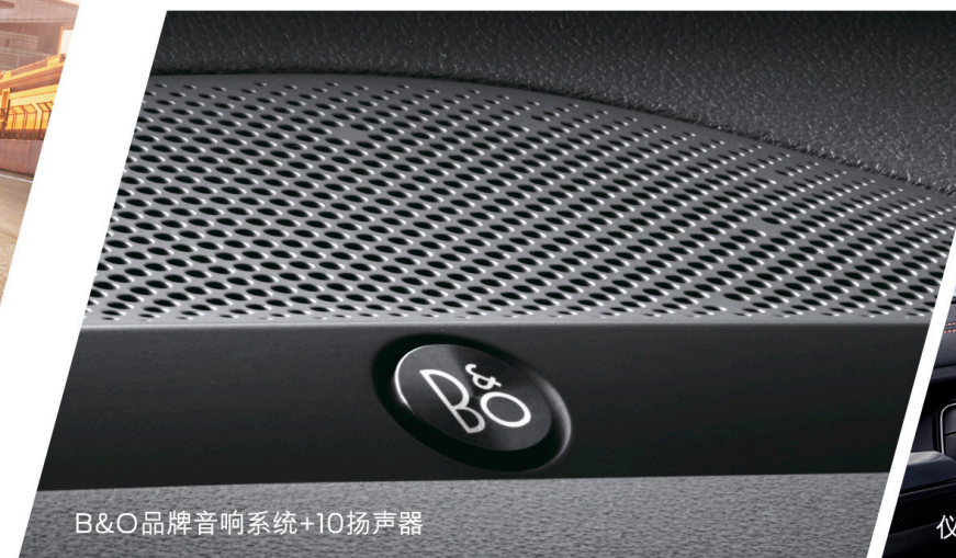
B&O品牌音响系统+10扬声器